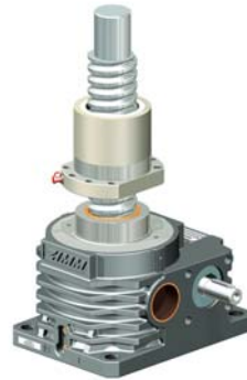
Hubgetriebe mit Kugelgewindetrieb

Fotos in druckfähiger Größe anfordern unter: s.laesser@zimm.at Veröffentlichung honorarfrei mit dem Hinweis: ZIMM